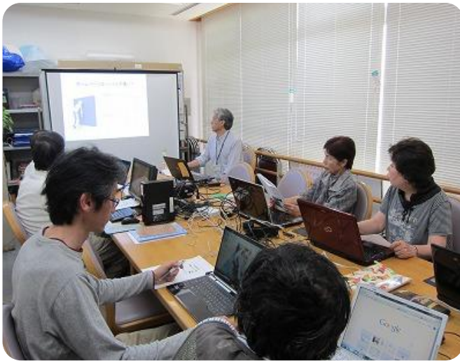
受講風景（市民活動サポートセンター会議室）

1月の講座を受講できなかった団体のために、5月24日と25日の2日間連続で講座を開催しました。受講された皆様は、大変意欲的にホームページ作りに取り組みました。