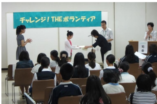
優良ボランティアを表彰 今年は8名が受賞