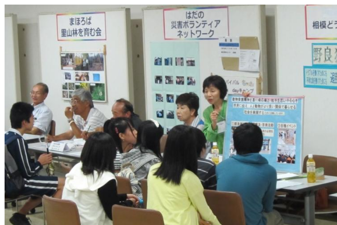
各団体のブースで熱心に説明を聞く 学生の皆さん