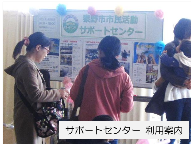
サポートセンター 利用案内

平成28年2月7日(日) 秦野市市民活動サポートセンター(運営主体:れんきょう)は、活動内容PRのため、昨年に引き続き秦野市保健福祉センターフェスティバルに参加しました。