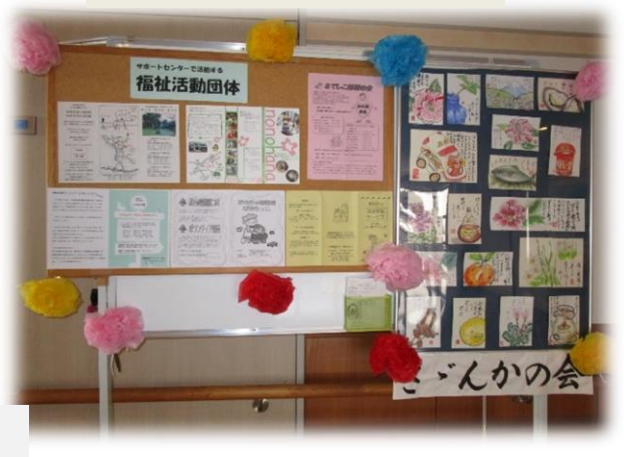
福祉活動団体紹介

平成29年2月5日（日）秦野市市民活動サポートセンター（運営主体：れんきょう）は、活動内容PRのため、今年度も秦野市保健福祉センターフェスティバルに参加しました。