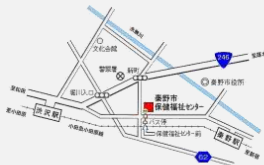
【MAP】秦野市市民活動サポートセンター