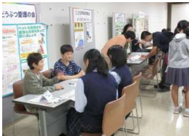
各団体のブースで熱心に説明を聞く学生の皆さん