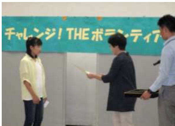
10回以上ボランティア体験をした「優良ボランティア」を表彰しました。