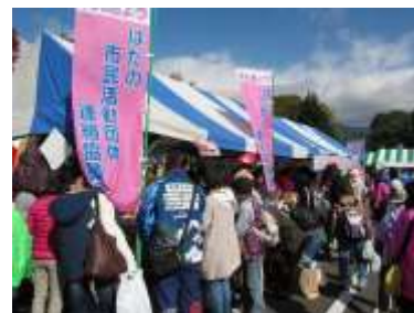
昨年のバザー風景

当日運営のお手伝いやバザー品の提供等…みなさまの温かい ご支援・ご協力をお願いいたします。