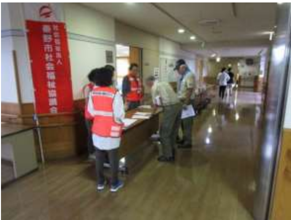
体験講座受付風景

訓練は、大規模地震の発生を想定して行われました。当日は、市民を始め、行政、各種活動団体が参加しました。参加者はまず『災害ボランティアセンターの機能』や『災害ボランティアの心得』についてレクチャーを受けた後、ボランティアの登録・求人・派遣の手続き、そして帰着までの流れをボランティア役とセンター係員役とに交互に分かれて体験しました。また、災害ボランティアセンターの運営に関する模擬会議にも参加して、その運営には十分な下準備と臨機応変な対処が求められることを再認識していました。