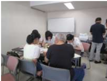
ボランティア冊子 (表紙)

今年度も、学校の先生方にもご協力いただき、ボランティア情報が掲載された冊子を生徒に配布しました。れんきょう加盟団体の中から13団体が受け入れに協力していただきました。また、今回新たに市主催・共催等のボランティアも参加し、例年を超える19団体20テーマでの開催になりました。