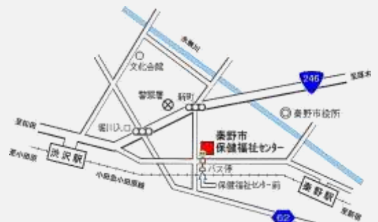
【MAP】秦野市市民活動サポートセンター