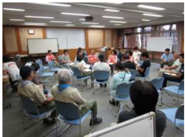
模擬運営会議風景